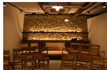
ラウンジ内部・かつては農具置き場だった

実力、人気ともに日本を代表するギター奏者。9歳よりギターを始め、1963年に巨匠イエベスに認められ、翌年スペインで師事。74年NHK教育テレビ「ギターを弾こう」、07年同「趣味悠々」に講師として出演。08年ビルバオ交響楽団の定期演奏会に出演。15年にはイ・ムジチ合奏団と共演。17年からギターの様々な可能性を追求する「荘村清志スペシャル・プロジェクト」(全4回)に取り組み、19年にはデビュー50周年を迎えた。20年、朝日新聞の連載「人生の贈りもの」をまとめた書籍「弾いて飲んで酔いしれて ギターとともに50年」(吉田純子編著)を出版。21年、アルベニスの作品を集めた最新盤「旅の思い出」をリリース。現在、東京音楽大学客員教授。