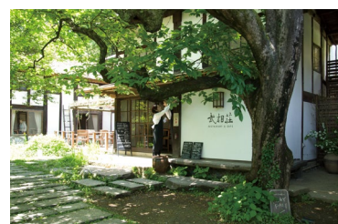
カフェ&レストラン武相荘

◇イベント専用窓口 TEL.090-4367-9708 (平日 10:00-17:00)