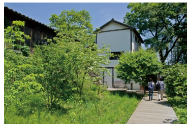
5月・新緑に囲まれる能ヶ谷ラウンジ